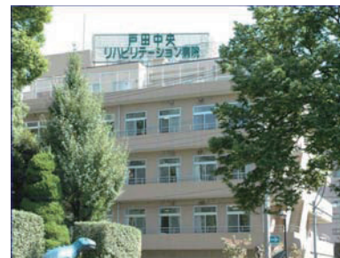
戸田中央リハビリテーション病院