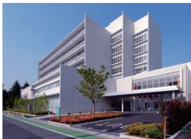
戸田中央総合病院