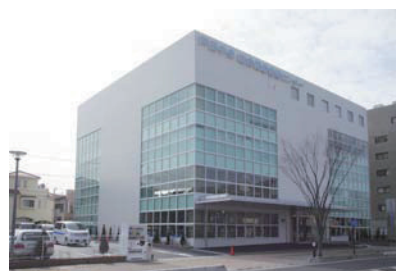
戸田中央総合健康管理センター