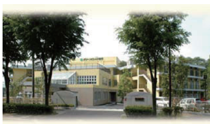
介護老人保健施設 グリーンビレッジ安行