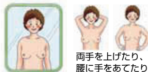
両手を上げたり、 腰に手をあてたり