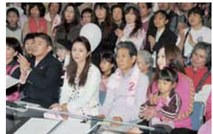
2010年度のピンクリボンウォークの様子