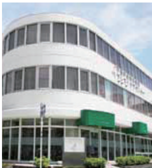
当院の乳腺外科 ブレストケアセンター

乳房専用のX線撮影のことをいいます。触診では診断できない微細な乳がんの発見に有効です。