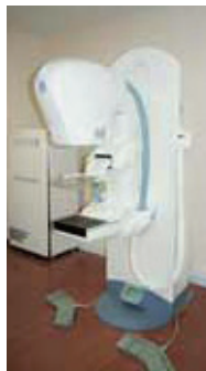
マンモグラフィー 撮影装置