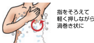
指をそろえて 軽く押しながら 渦巻き状に