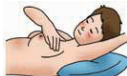
座ぶとんを敷いて、 腕を上げながら