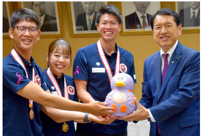
埼玉県議会議長・立石 泰広 議長表敬訪問の様様 (6月26日)