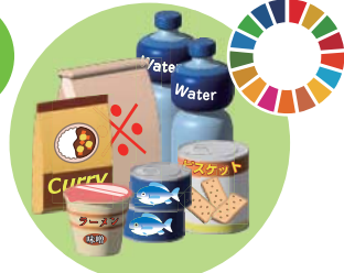
SDGs フードドライブを実施! ご家庭で余っている食材をお持ちください