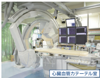
心臓血管カテーテル室

心臓血管センターには、2つの循環器病棟・CCU(6床)・外来があります。内科と外科が連携し、狭心症、心筋梗塞、弁膜症、大動脈解離、閉塞性動脈硬化症まで含めた循環器疾患を診療しています。外科は冠動脈バイパス手術やステントグラフト内挿術、内科は冠動脈・下肢動脈カテーテル治療、不整脈のカテーテル治療などの救命医療が行える体制で24時間受け入れ可能です。