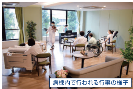
病棟内で行われる行事の様子