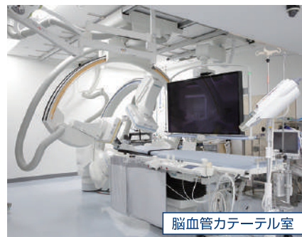
脳血管カテーテル室

脳神経外科/脳血管内治療科では、患者さまへの負担が少ない治療として、専門医による神経内視鏡手術とカテーテルによる血管内治療手術に早期から取り組んでいます。2001年から神経内視鏡による鍵穴手術を導入し、脳出血の治療を行っています。また、2003年から脳血管内治療を取り入れ、脳動脈瘤塞栓術、頸動脈ステント留置を中心に施行しています。